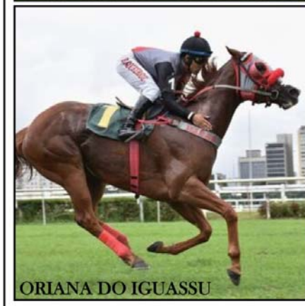
ORIANA DO IGUAÇU