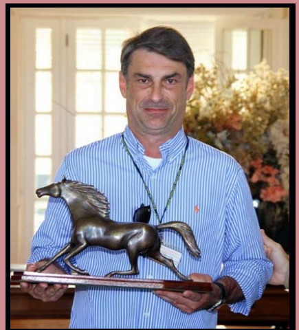
e o troféu de Melhores da temporada 2016/17 vai para.....