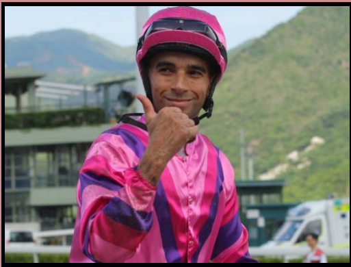
João Moreira formado na escola de aprendizes de SP é astro internacional no Turfe foi tomado por grande emoção ao ser premiado com troféu Pro Turfe aos melhores