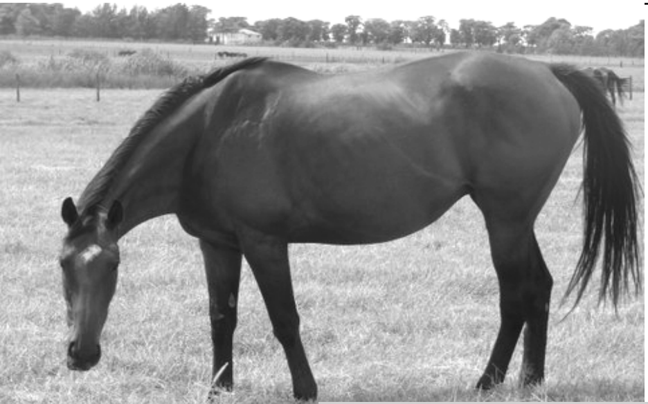
Deputy Jessie (USA)