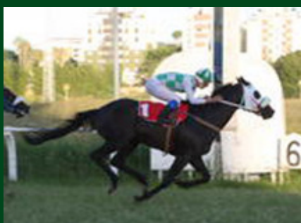
GP Derby Riograndense - L