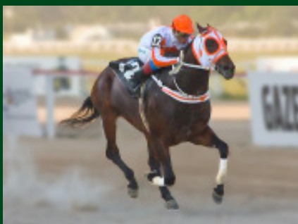
Triplice Coroado Paranaense