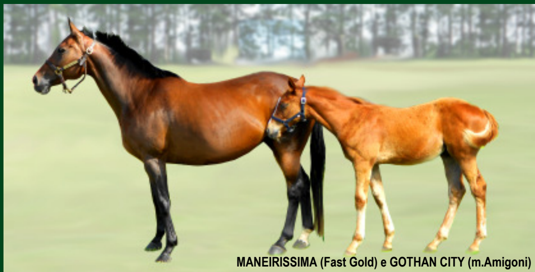
MANEIRISSIMA (Fast Gold) e GOTHAN CITY (m.Amigoni)

Você encontrará produtos da geração 2012, filhos de SHIROCCO, MACHO UNO, PURE PRIZE, TIGER HEART, AMIGONI, POUNCED, INEXPLICABLE, IMPRESSION, HOLZMEISTER, e a primeira geração de PUBLIC SPEAKER.