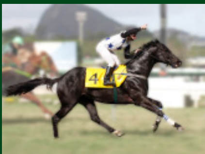
Prova Especial Mossoró