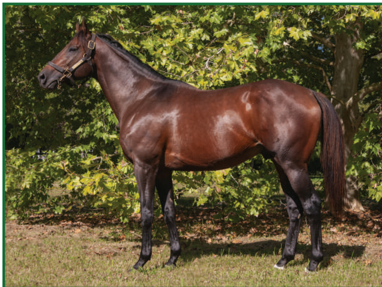
“Cavalo de 4 e + anos”

Put It Back e Bye Bye Caroline, por Royal Academy