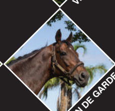
VIN DE GARDE