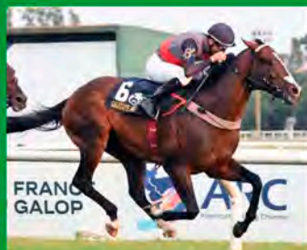
1º GP PELLEGRINI – G1