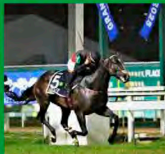
1º GP LATINO – G1