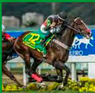
1º GP BRASIL – G1