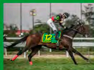
1º COPA CLÁSSICA – G1