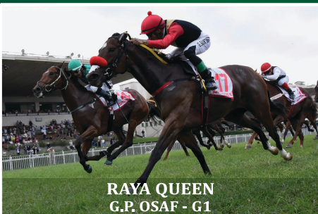
RAYA QUEEN G.P. OSAF - G1