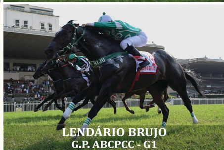
LENDÁRIO BRUJO G.P. ABCPCC - G1