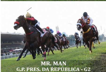
MR. MAN G.P. PRES. DA REPÚBLICA - G2