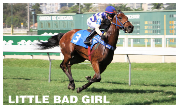
LITTLE BAD GIRL