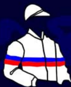
HARAS DOCE VALE