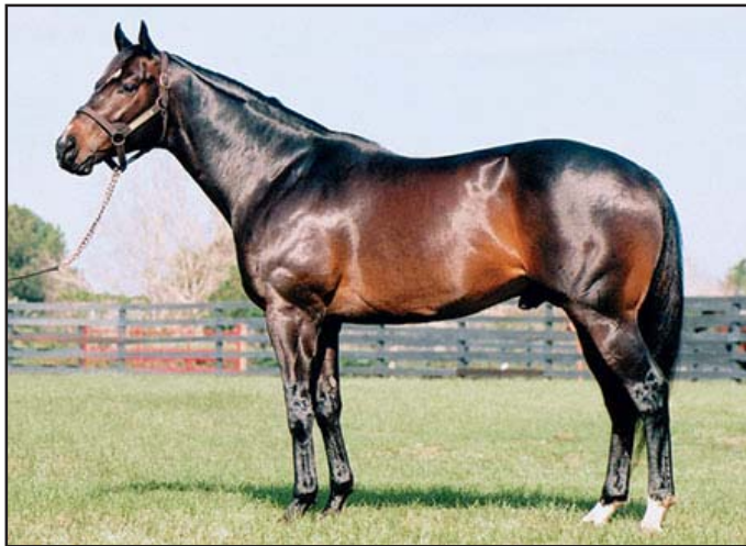
Tricampeão do Troféu Mossoró

Honour And Glory e Miss Shoplifter, por Exuberant