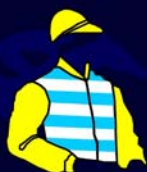
STUD ETERNAMENTE RIO