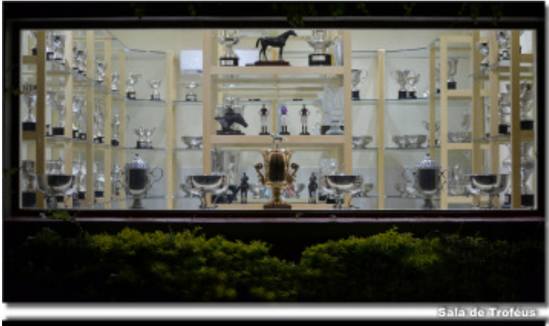
Sala de Troféus