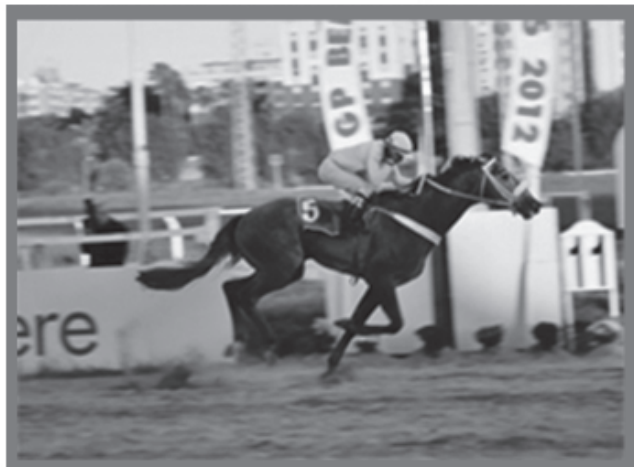
BEDUINO DO BRASIL - CAMPEÃO DO GP BENTO GONÇALVES 2012

14 de Novembro - 2013 Quinta-Feira Após as corridas Na Boate LIV & FLY