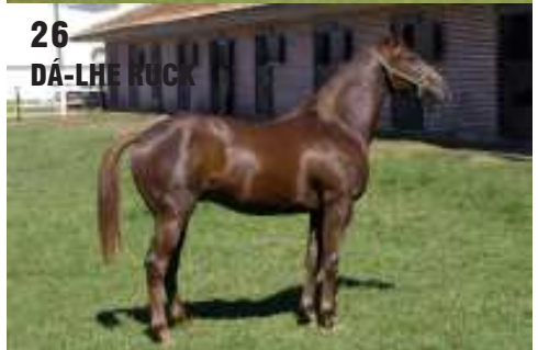
26 DÁ-LHE RUCK