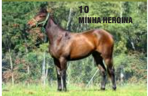
10 MINHA HEROINA