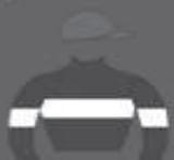
MOLETTA fundado em 1986