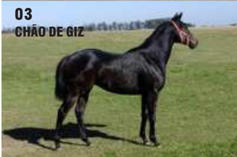
03 CHÃO DE GIZ