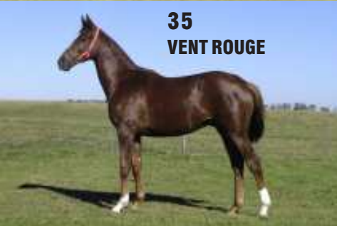
35 VENT ROUGE