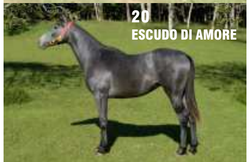
20 ESCUDO DI AMORE