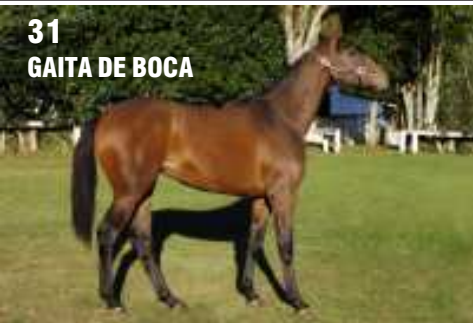
31 GAITA DE BOCA