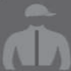
CENTAUROS fundado em 2009