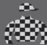
ST. TEREZA fundado em 2008