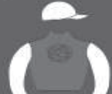
GRIPEN fundado em 1911