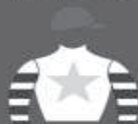
DUIGLIO B. fundado em 1968