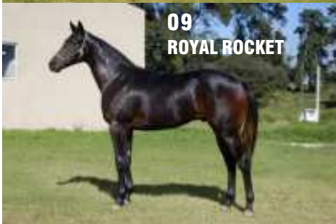
09 ROYAL ROCKET