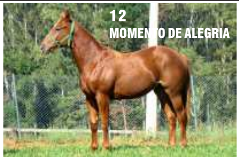
12 MOMENTO DE ALEGRIA