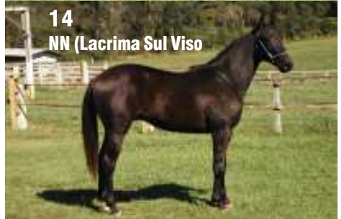
14 NN (Lacrima Sul Viso)