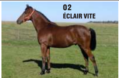
02 ÉCLAIR VITE