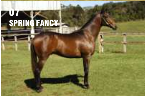
07 SPRING FANCY