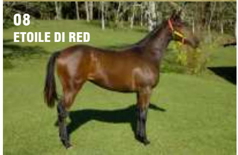
08 ETOILE DI RED