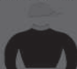
GUAMIRANGA fundado em 1979