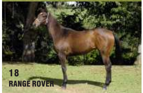
18 RANGE ROVER