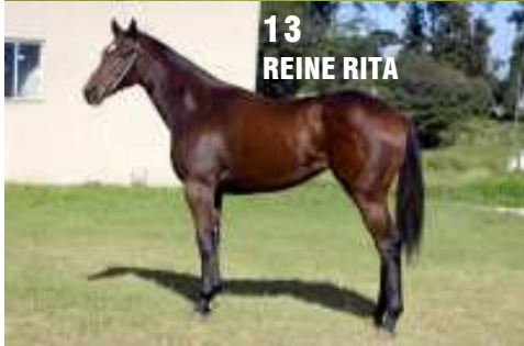
13 REINE RITA