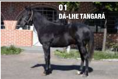
01 DÁ-LHE TANGARÁ