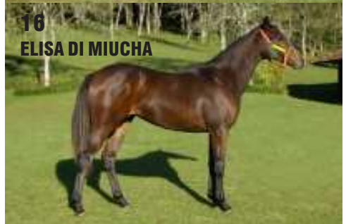
16 ELISA DI MIUCHA