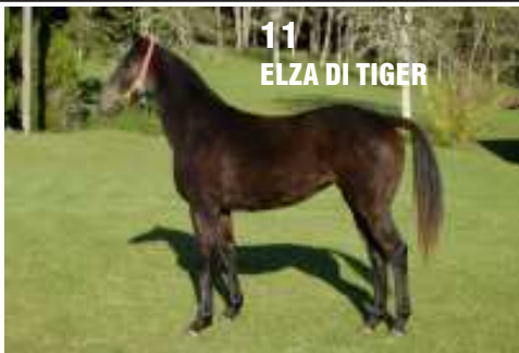
11 ELZA DI TIGER