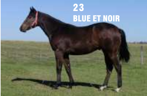
23 BLUE ET NOIR