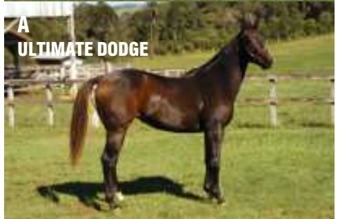
A ULTIMATE DODGE