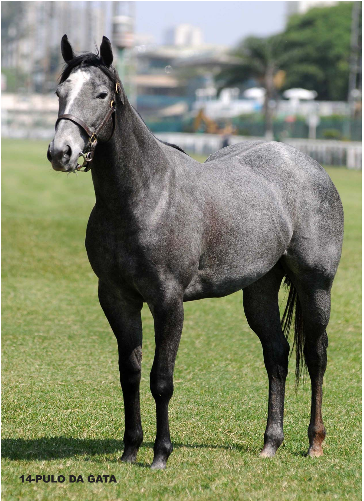
14-PULO DA GATA