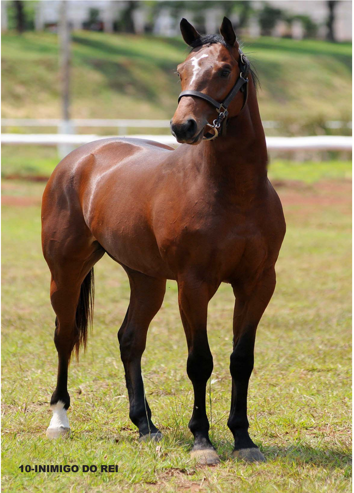
10-INIMIGO DO REI