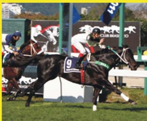
Barão da Cevada vencendo G.P.Major Suckow (G.I) para o The Best