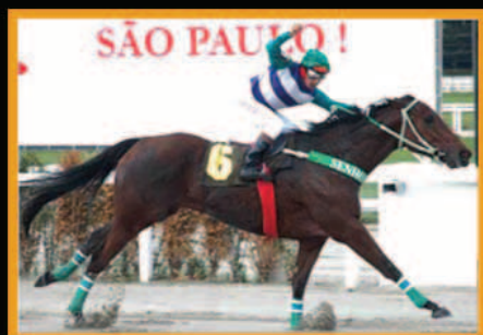
ALEGRIA DE POBRE GP Roberto A. Almeida - G2