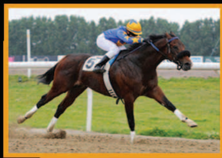
VERDE-MAR Batendo record na Suécia