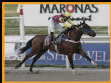
TELEBREEZE Clás.Agraciada - G3