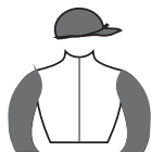
SÃO JOSÉ DA SERRA