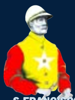
S.FRANCISCO DA SERRA