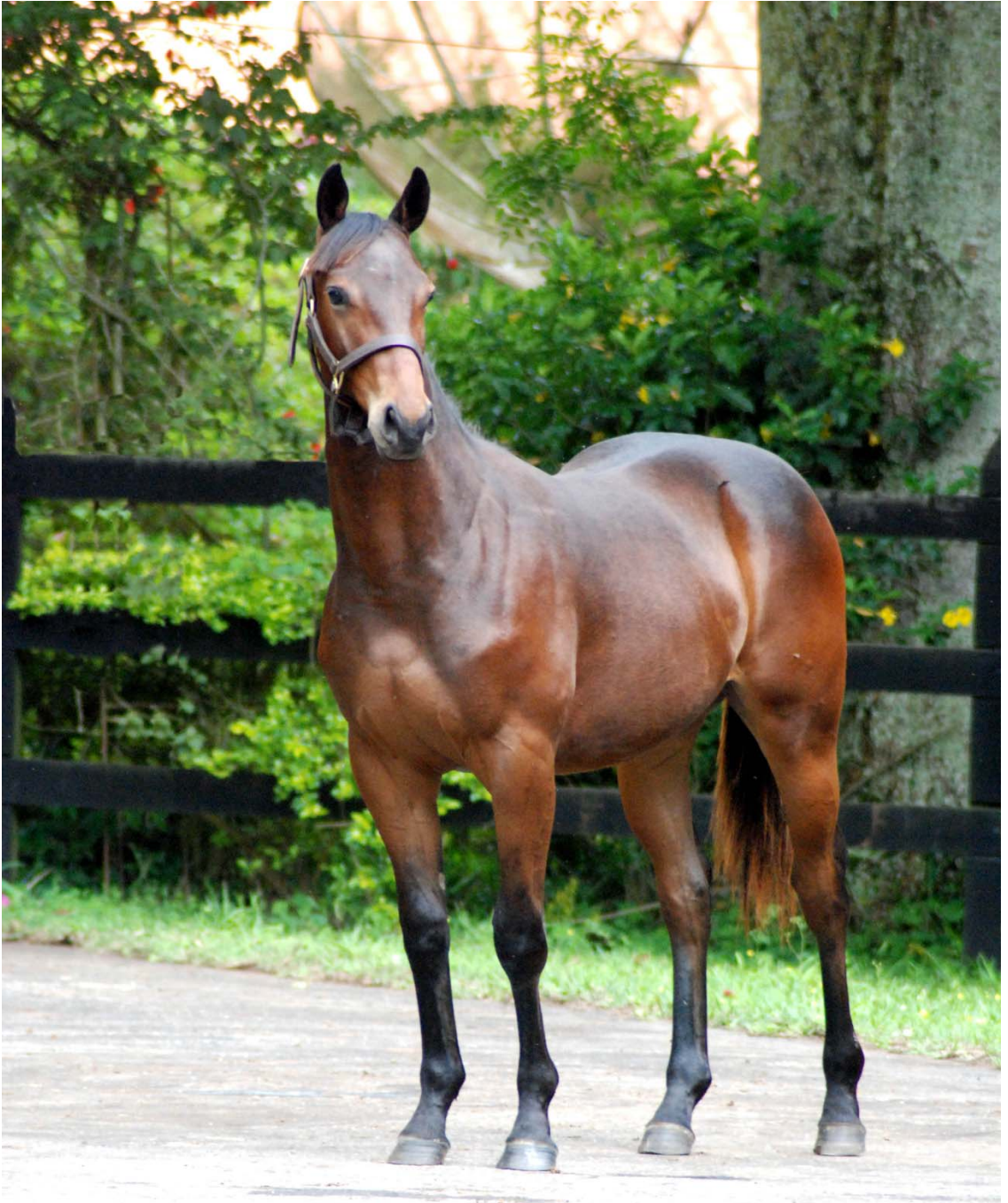
18 - RAI0 DE LUAR