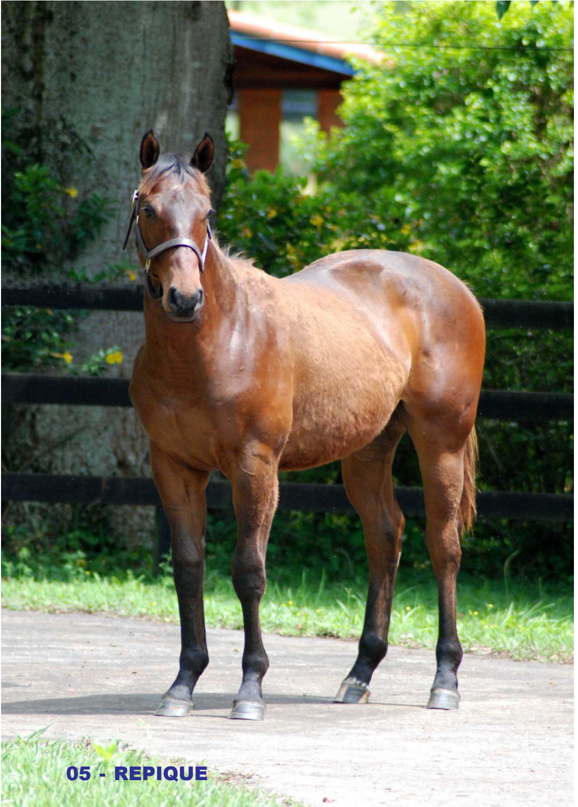
05 - REPIQUE