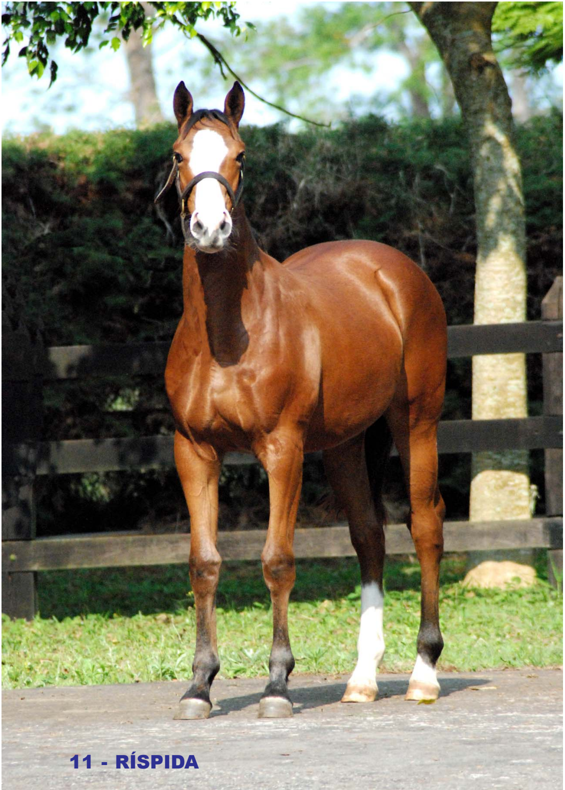
11 - RÍSPIDA