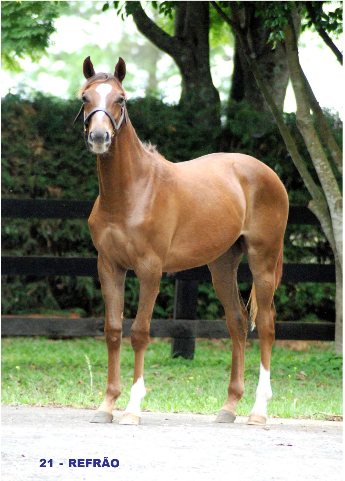
21 - REFRÃO