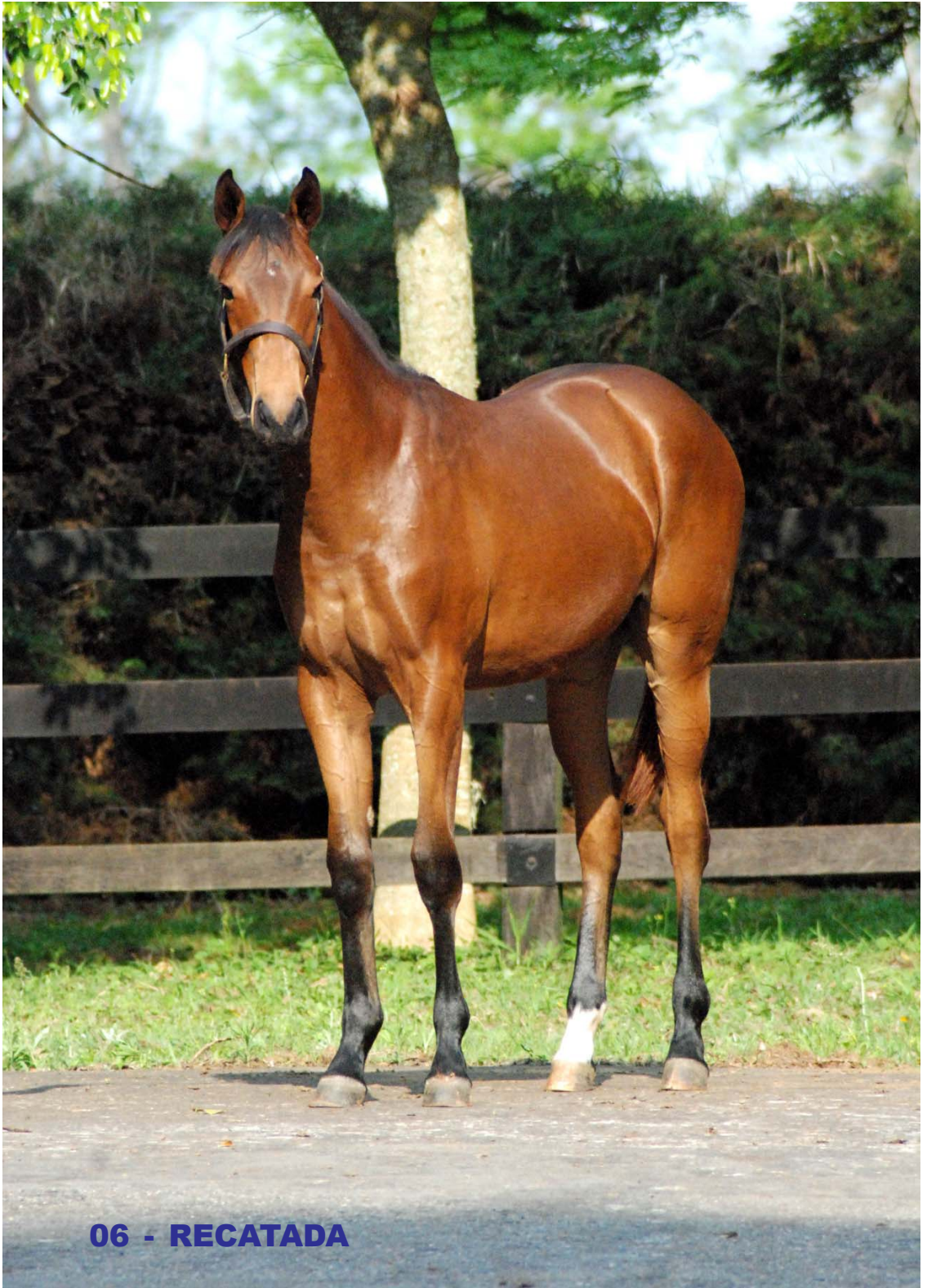
06 - RECATADA