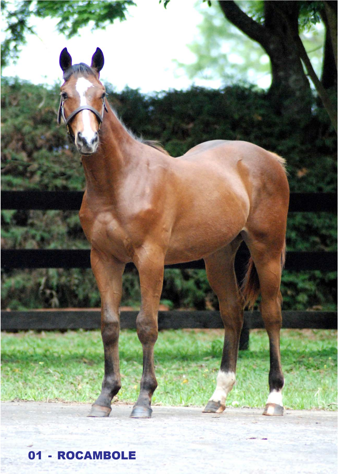
01 - ROCAMBOLE