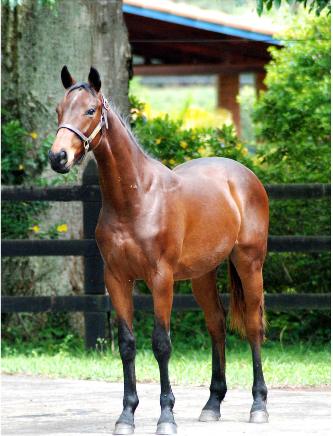
03 - RÁ TIM BUM