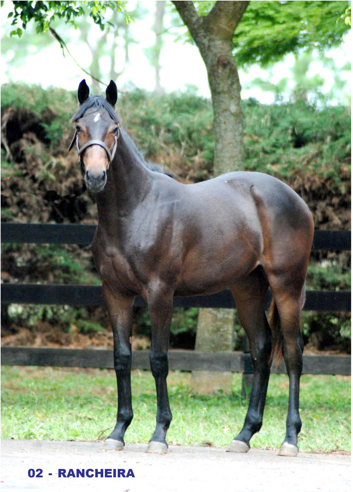
02 - RANCHEIRA