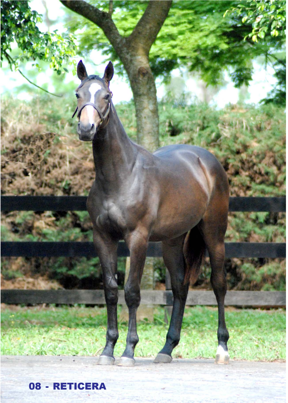
08 - RETICERA