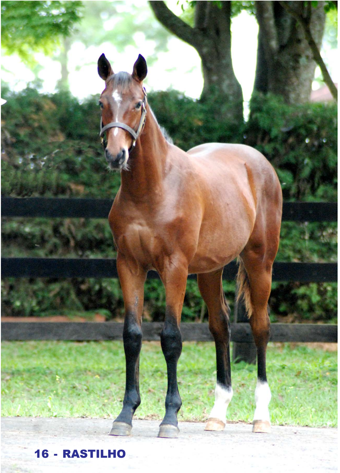
16 - RASTILHO