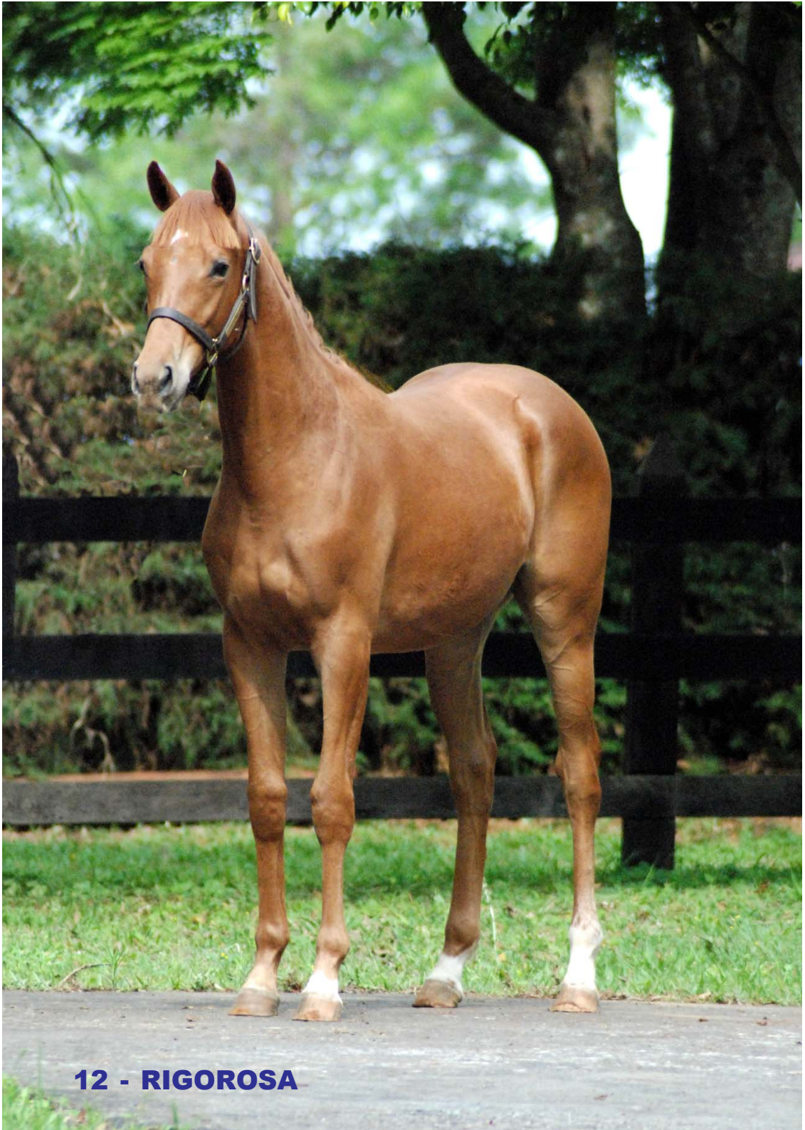
12 - RIGOROSA