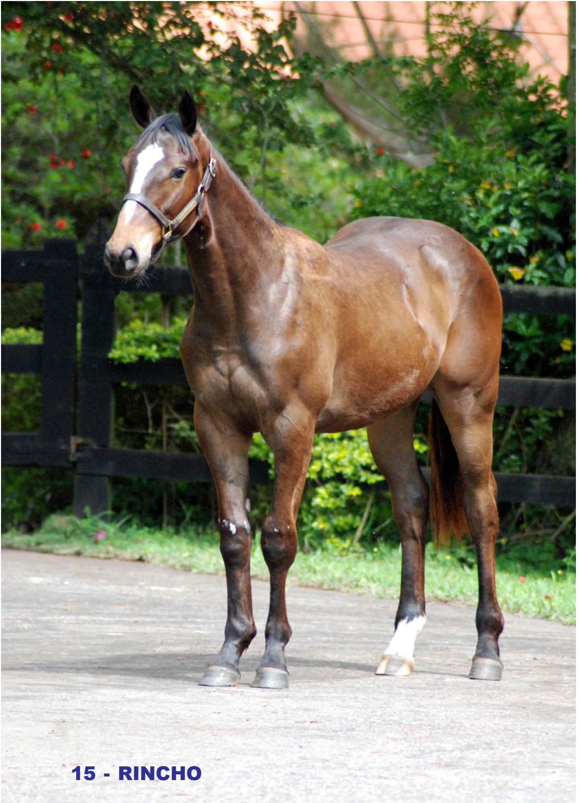
15 - RINCHO