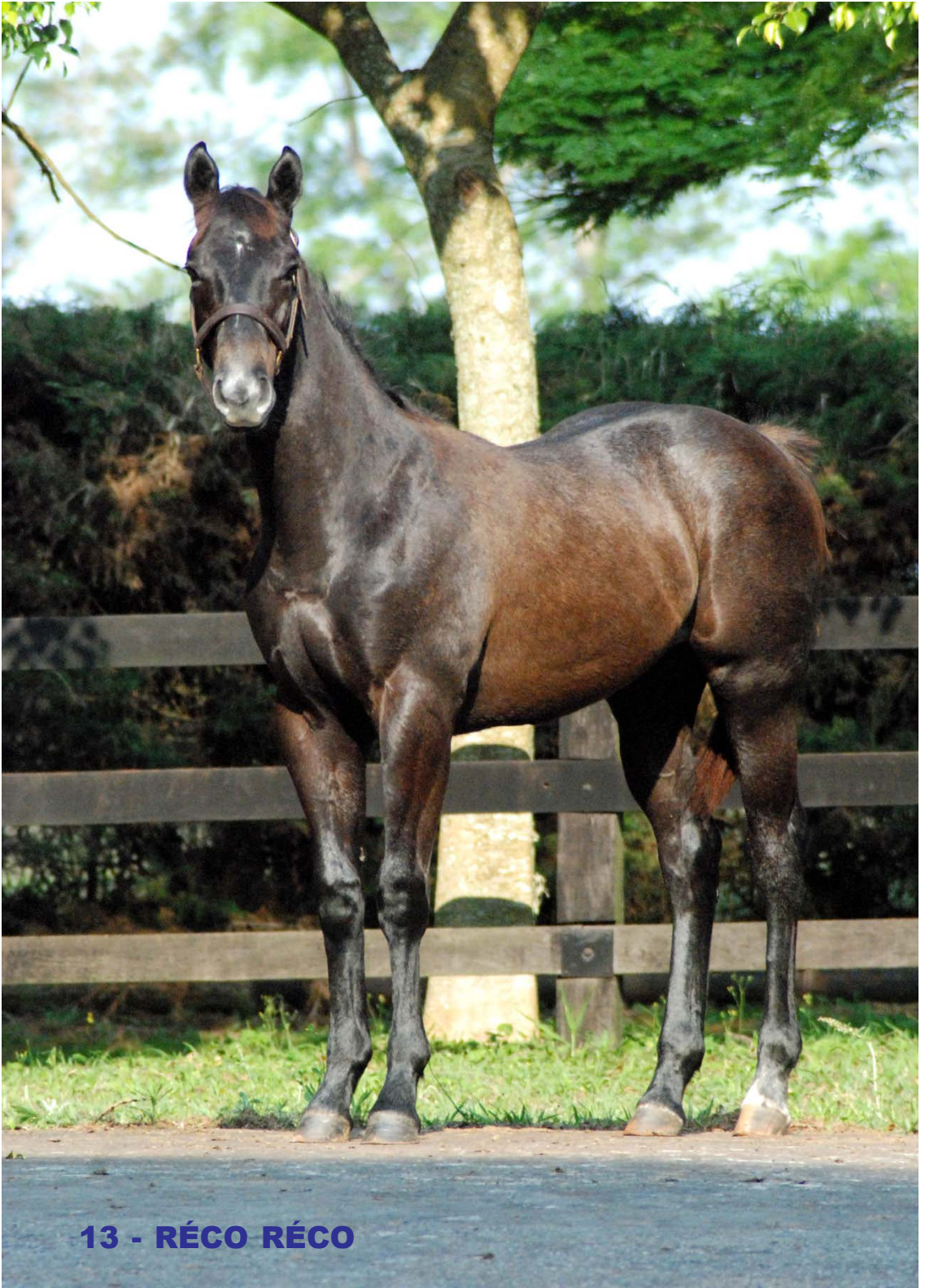
13 - RÉCO RÉCO