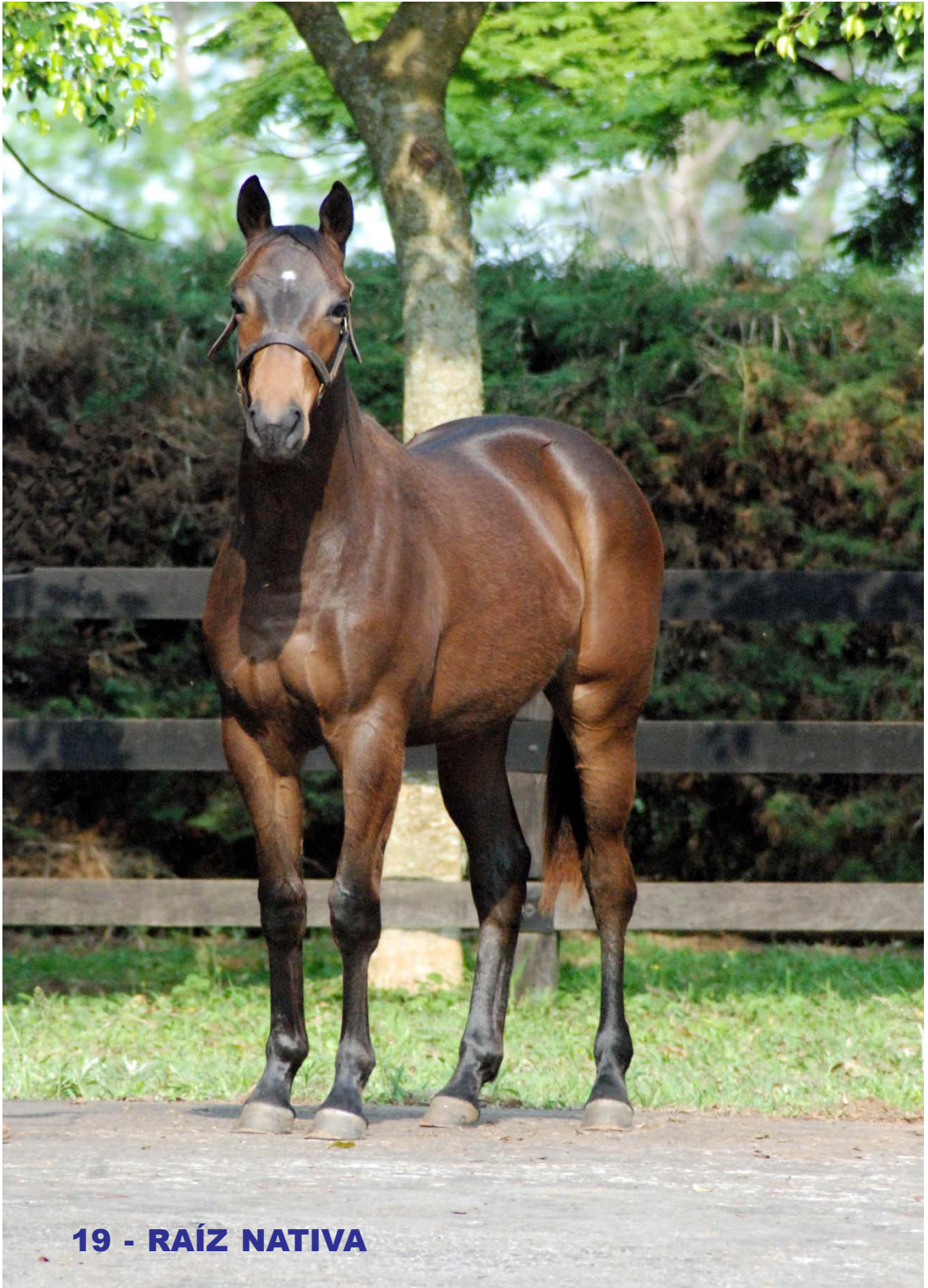
19 - RAÍZ NATIVA