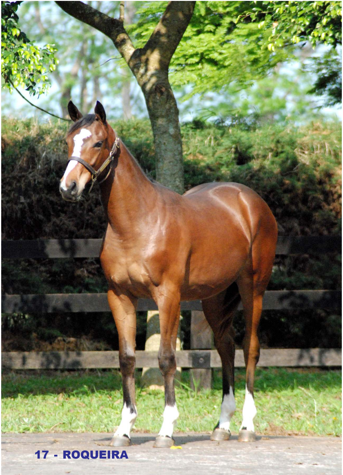
17 - ROQUEIRA