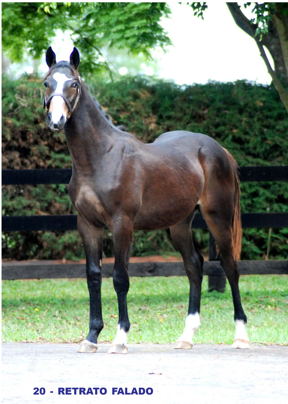
20 - RETRATO FALADO