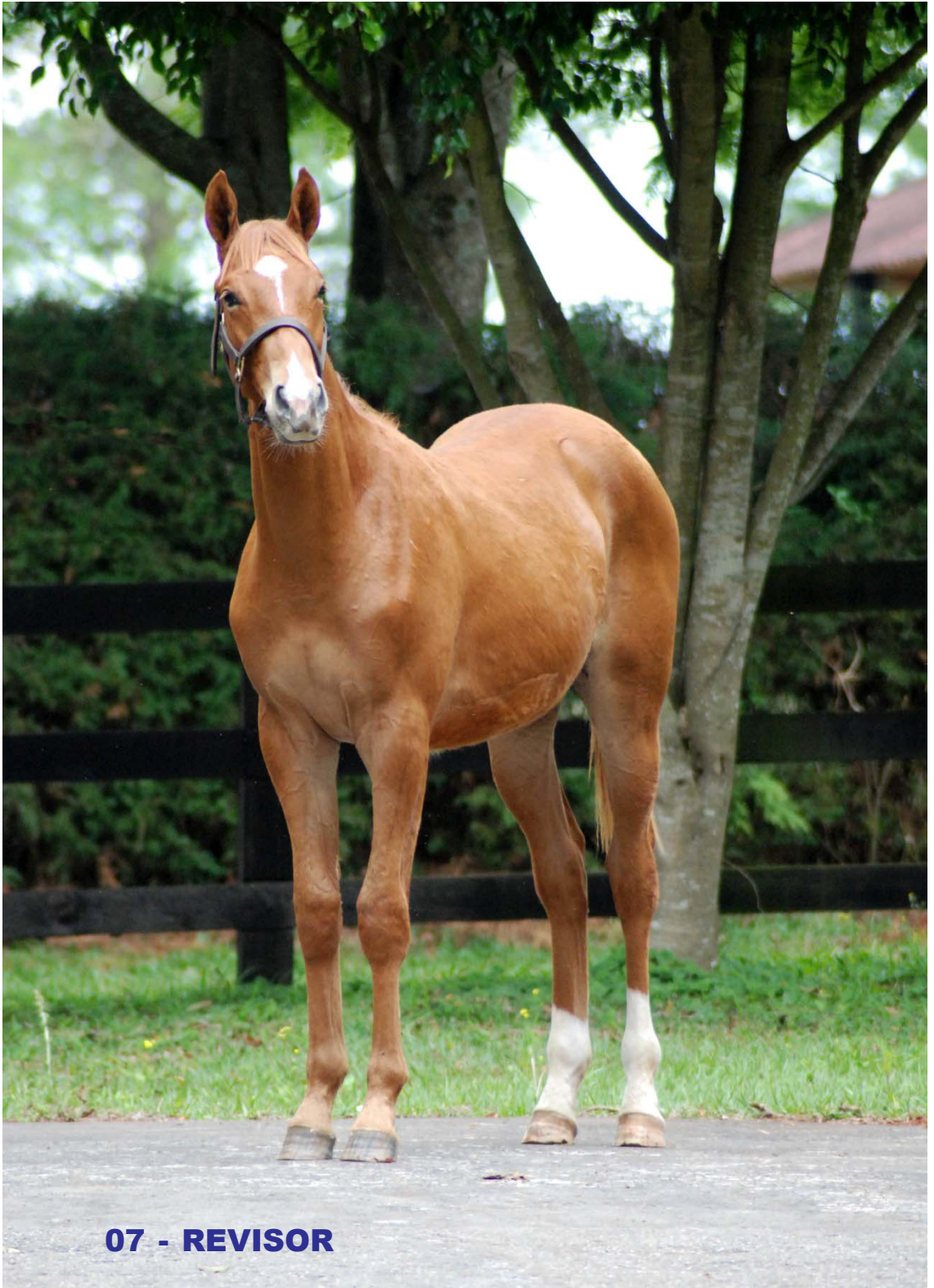
07 - REVISOR